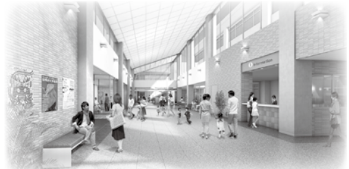
▲たかぴあエントランス イメージ図