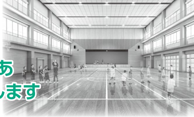
▲小学校体育館（メインアリーナ）完成イメージ図